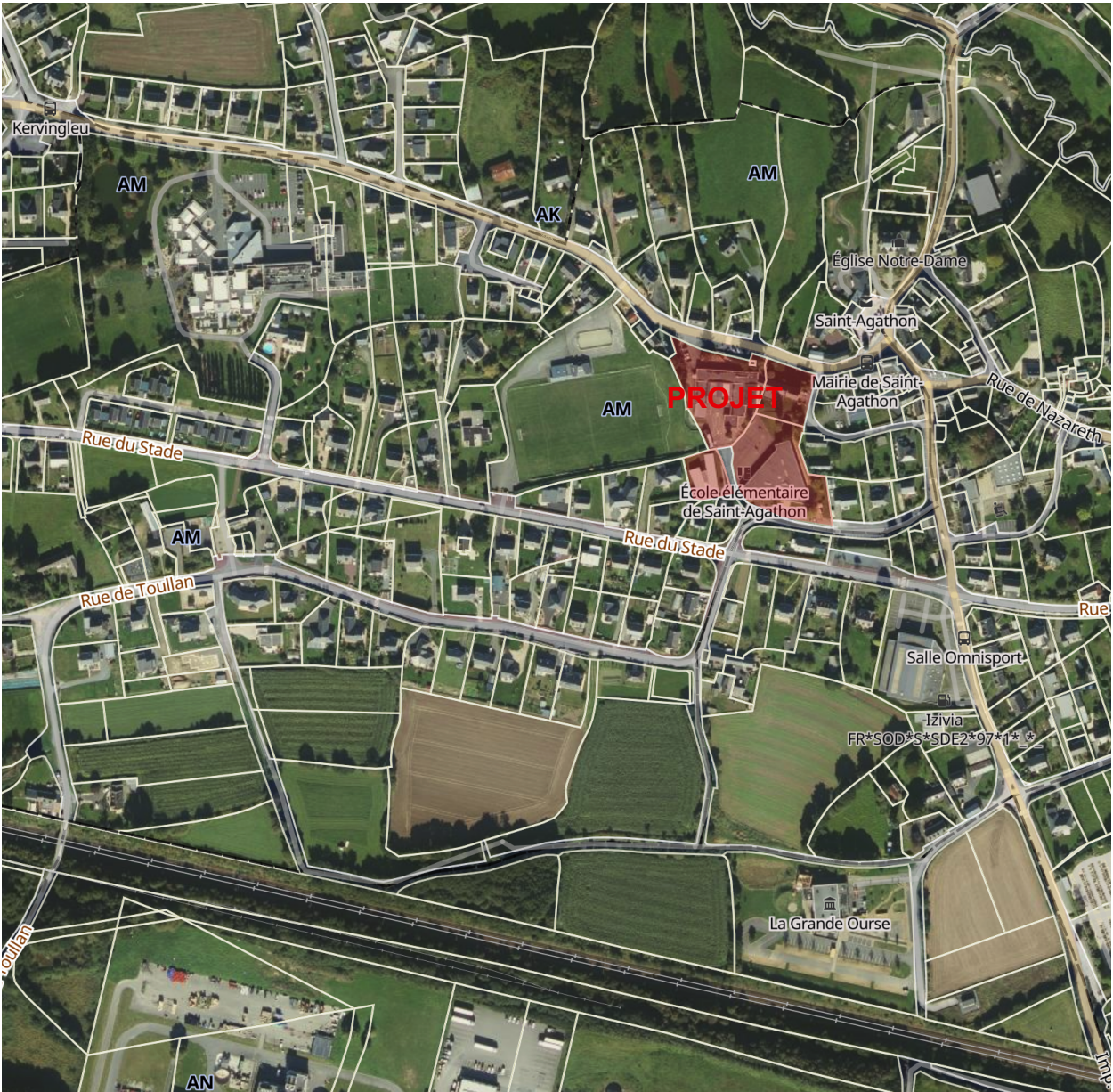
SITUATION sans échelle

Médiathèque : AM 66 1 402m 2 Ecole élémentaire : AM181 3 804m 2 ALSH : AM 175 908m 2 Emprise totale du groupe scolaire : 9575m 2